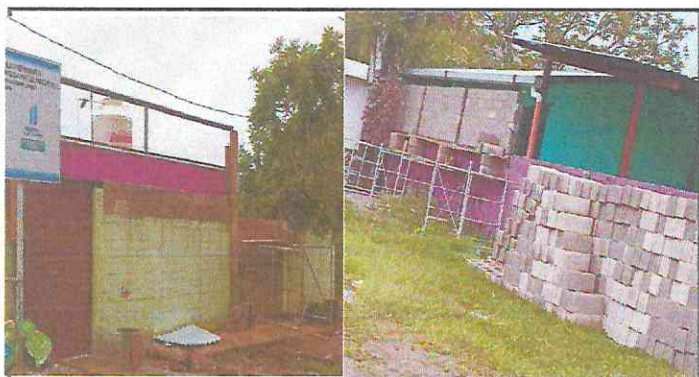
Foto 3: MÓDULO 2 FABRICACIÓN DE NUEVA PUERTA, CONTINUACIÓN DE MURO PERIMETRAL