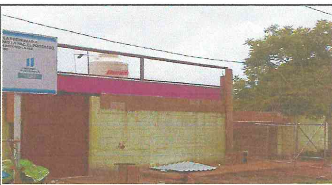
FOTO 4: MÓDULO 2 CONTINUACIÓN MURO PERIMETRAL, FABRICACIÓN DE PANTALLA SOBRE TERRAZA, SUSTITUCIÓN DE DEPOSITO DE AGUA